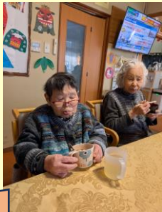
鏡開きで、ぜんざい