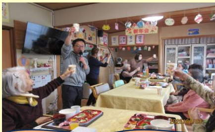
新年会!! ジュースで乾杯!!