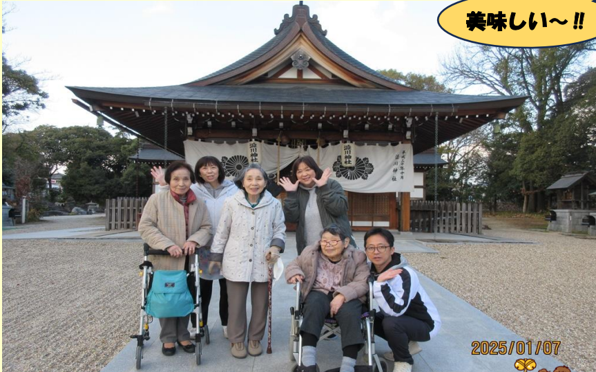
初詣に渋川神社へ。皆様何をお願いしたのかなあ?